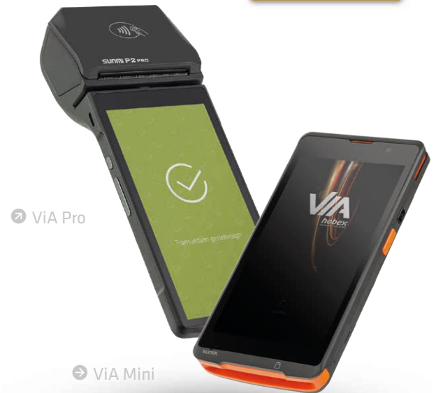
➔ ViA Pro